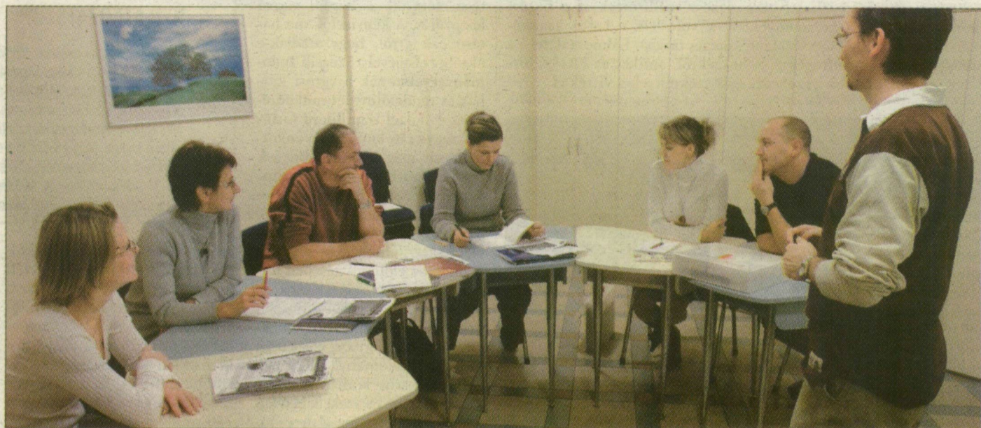
Tanuló csoport az egyik szegedi nyelviskolában

Míg a Szegedi Tudományegyetem altajszika tanszékén törökül, kazakul, kurjatul, sőt japánul is tanulhatnak az egyetemisták, a nyelviskolákban nem indítanak ilyen tanfolyamokat. A magánhirdetések között is csak az angol, német, olasz és francia órákat adó tanárok reklámozzák magukat.