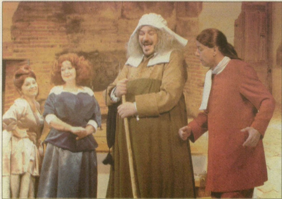
A windsori víg nőket a múlt szezonban mutatták be – ebben az évadban is játsszák

Az önkormányzathoz fordult a Szegedi Operabarátok Egyesülete, hogy tiltakozzon a város operakultúrájának leépítése ellen. A színház főigazgatója szerint rosszul látják, csupán arról van szó, hogy a mostani: átmeneti évad.