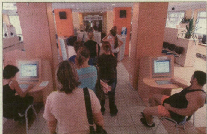
Fiatal álláskereső sor a munkaügyi központban.

Két feltétele van annak, hogy valaki a pályakezdő álláskereső törvényi feltételeinek megfelelően – magyarázták a munkaügyi központban. Az életkori kritériumok, másrészt az, hogy ne rendelkezzen a munkanélküli járadék megállapításához szükséges munkaviszonnyal. A legfeljebb középfokú végzettségűeknél 25 év, a felsőfokú végzettséggel rendelkező fiataloknál pedig 30 év a korhatár.