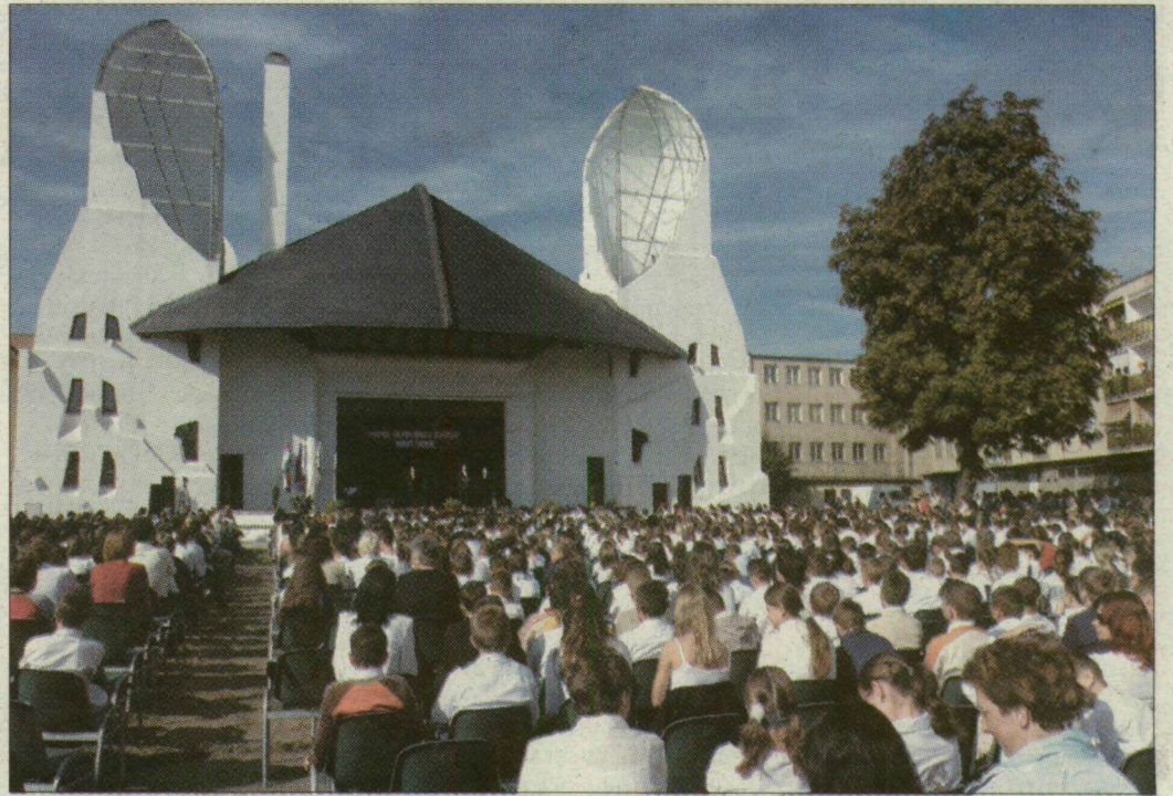
Az összevont makói általános iskola 1600 diákja a Hagymaház előtti tanévnyitón

hogy a szervezők nem takarították el időre a nemzetközi tisztai halfesztivál kellékeit. Eredetileg reggel hat órára kellett volna felszabadítani a rakpartot, de az útszakaszt csak negyed tizenegykor tudták megnyitni. A környezetgazdálkodási kht. autói már hajnalban megkezdtek volna a takarítást, de addig nem tudtak hozzáfogni, amíg a teherautókba pakolták a rendezvényhez használt tárgyakat.