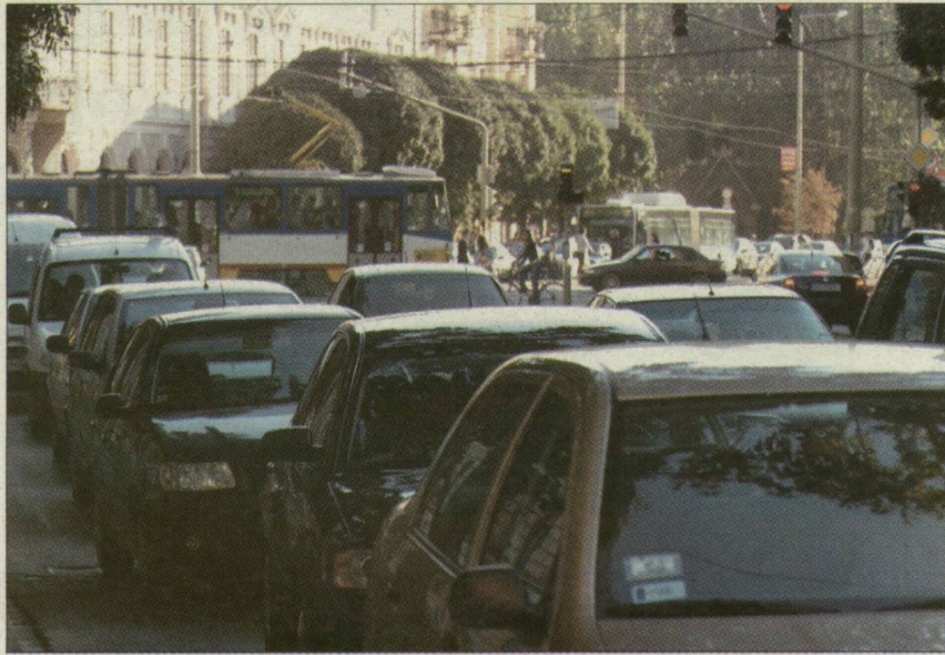
Egymásba értek az autók Szeged belvárosában tegnap reggel