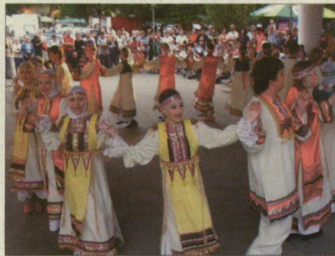
Tegnap néptáncosok toborozták a közönséget.