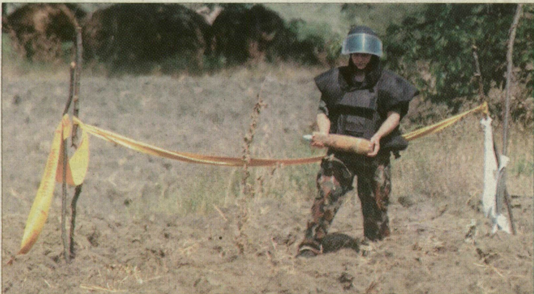
A tűzszerész óvatosan vitte a lövedéket a robbantás helyére