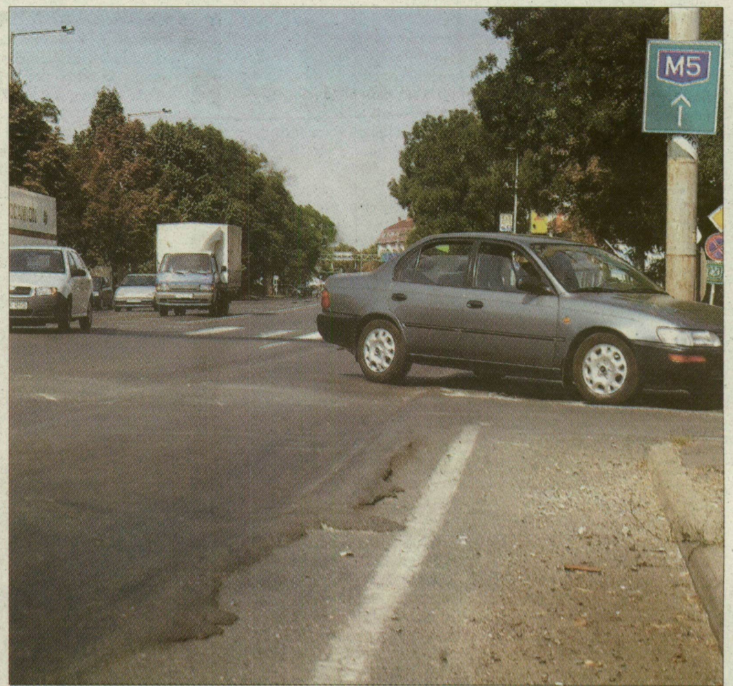
A szegedi nagyforgalmú úthálózaton a járművek a mély nyomvályúk miatt

A szőnyvőt emlékeztettük, hogy Szegeden úthiba miatt már halálos baleset is történt, egy segédmotoros a Kálvária sugárút Londoni körút kereszteződésében elesett és meghalt. A bíróság a Szegedi Közlekedési Társaságot marasztalta el, ugyanis a végze-