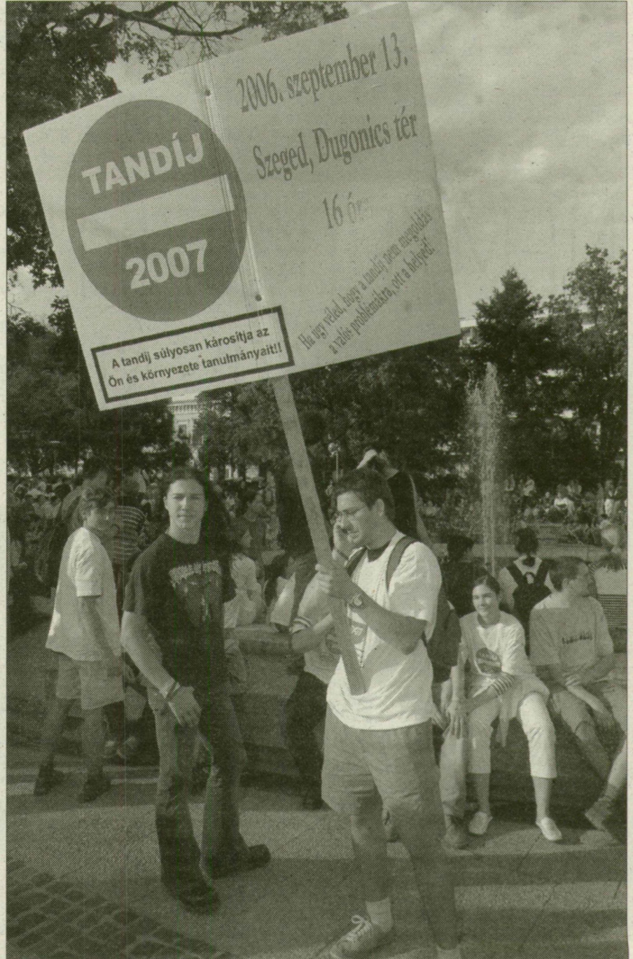
Nem kell lecserélni a táblát