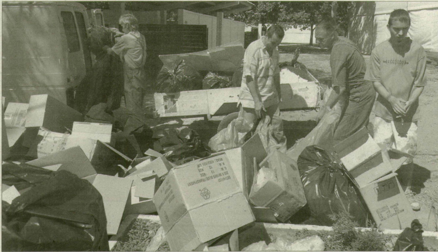
Tegnap délelőtt még javában takarítottak a Partfűrdőn

A SZIN idején a kht. ötven dolgozója folyamatosan szedte a szemetet, és háromóránként ta-