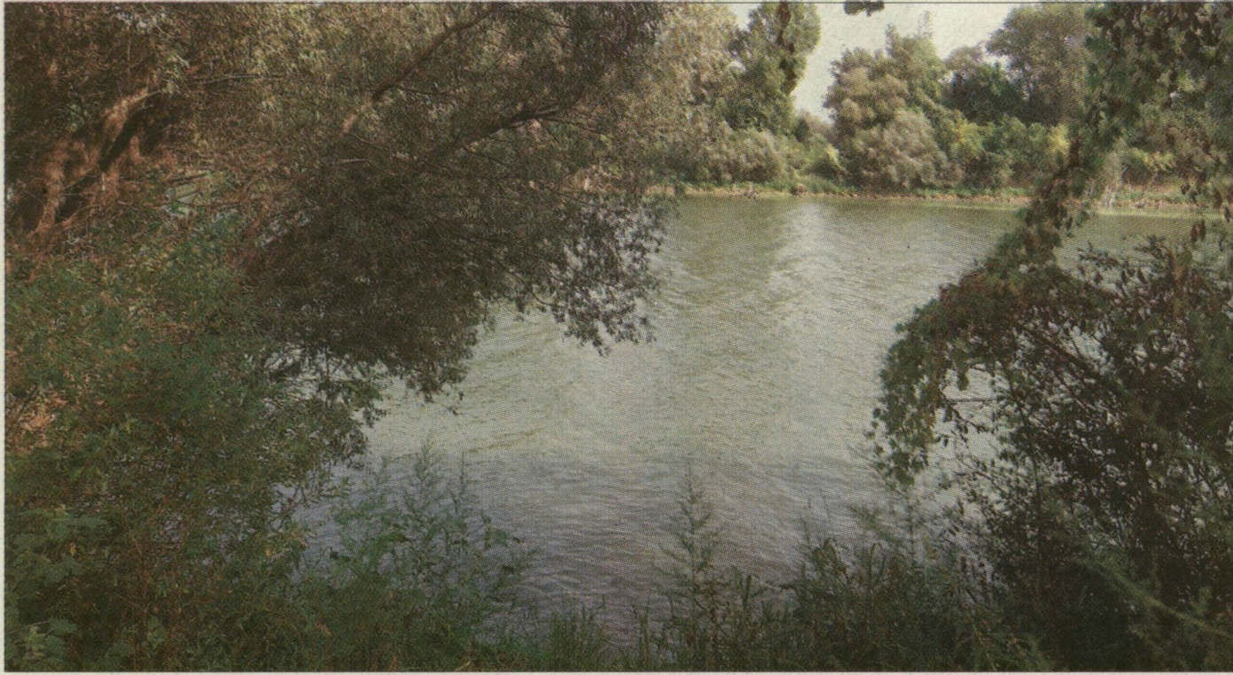
A 900 méter hosszú híd ezen a helyen vezet majd át a folyón. Elkészítése tovább tart, mint az utépítés Makóig