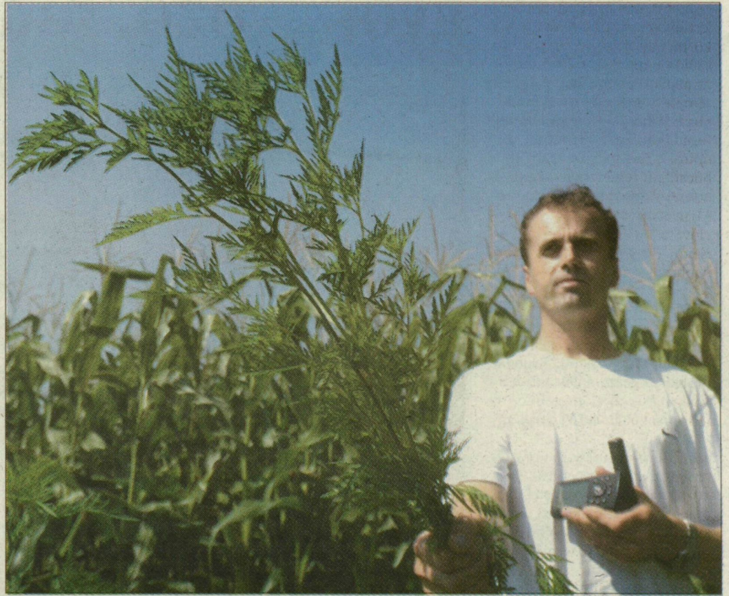
Az allergiások legfőbb ellensége Gyálaréten javában virágzik

A szegedi belterületek parlagfű-szennyezettségéről két hónap alatt nyolcvan bejelentést kapott az önkormányzat. Négy esetben szabott ki az általános igazgatási iroda növényvédelmi bírságot – a területük nagyságával arányosan. A megyében Kistelek, Zákányszék, Zombó külterülete bizonyult a legfertőzöttebbnek. A vásárhelyi növény- és talajvédelmi szolgálat 103 helyen razzizott, 78 hektár miatt kezdtek eljárni. 51 helyen a gazdák végeztek el a gyomtalanítást az aratásakor, 22 esetben a szolgálat kényszerkaszáltatta. A területméretek miatt kis összegű bírságokat szabtak ki, eddig összesen kétfélmillió forint értékben.