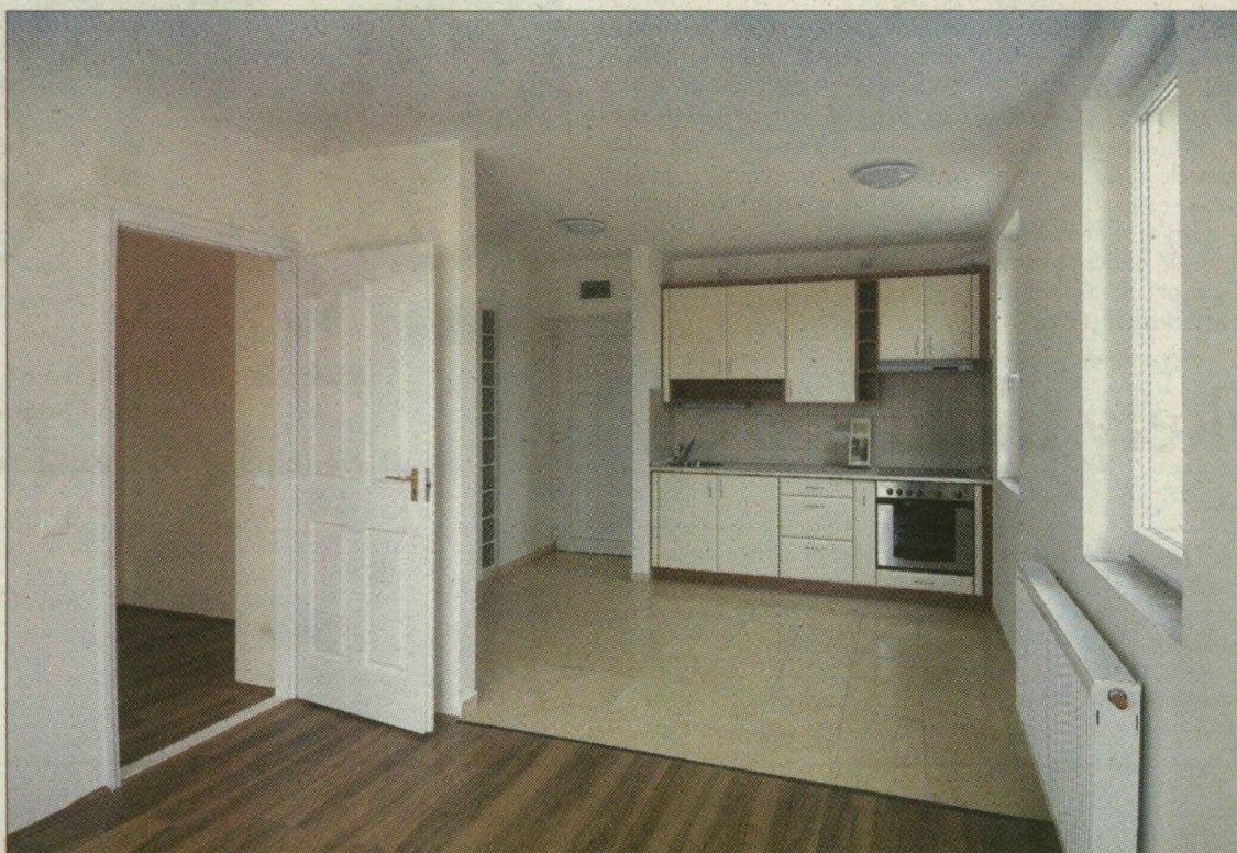
A 7,5 millió forint értékű ingatlan készen várja leendő gazdáját