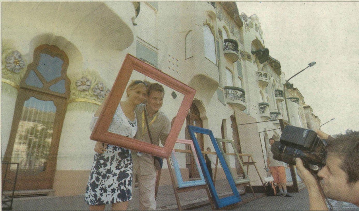
Keretek és háttér. Aki kérte, arról emlékfotó készült a palota avatása előtt