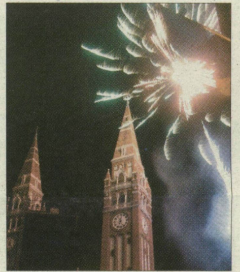
Tűzijáték idén is lesz

den át. Ahogy azt is számba vettük az új kenyér ünnepén, hogy hány dolgos kéznek kell munkálkodnia azon, hogy a búzából, majd a lisztből finom, illatos cipő kerüljön az asztalunkra. Írásaink a 3., a 7. oldalon és a Sziesztában