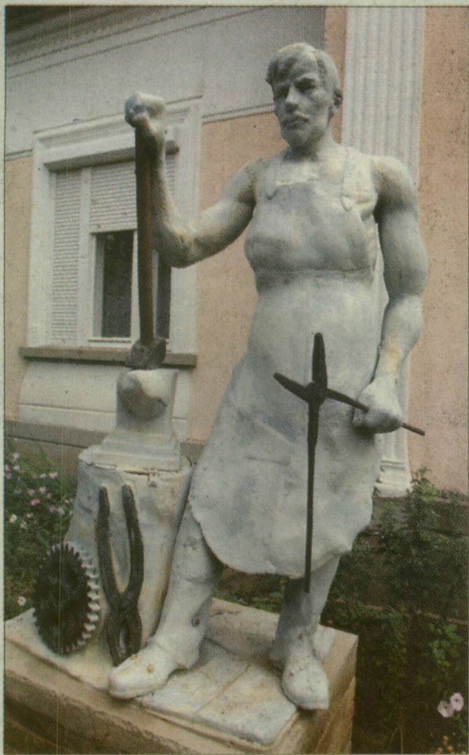
Nyolcvan éve vár, patkolásra készen