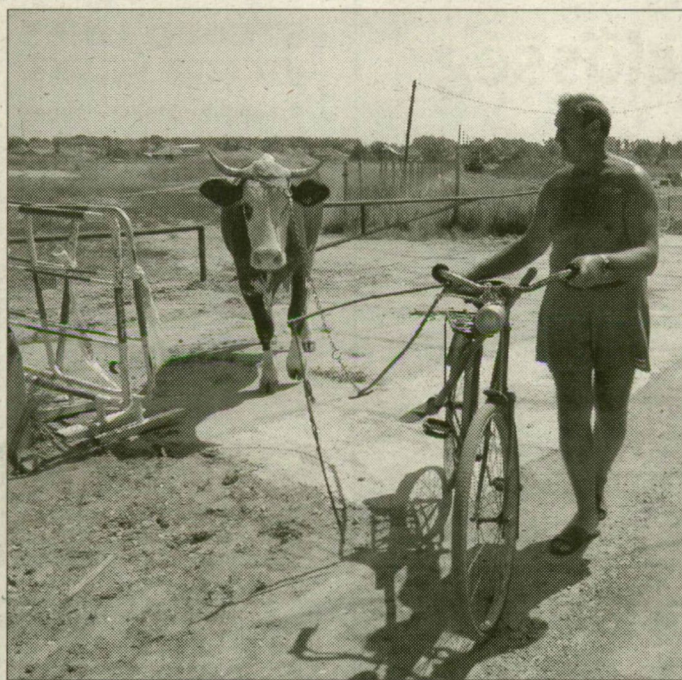
Itt épült volna a torony. A közigazgatási hivatal szerint a kiadott építési engedély több ponton szabálysértő