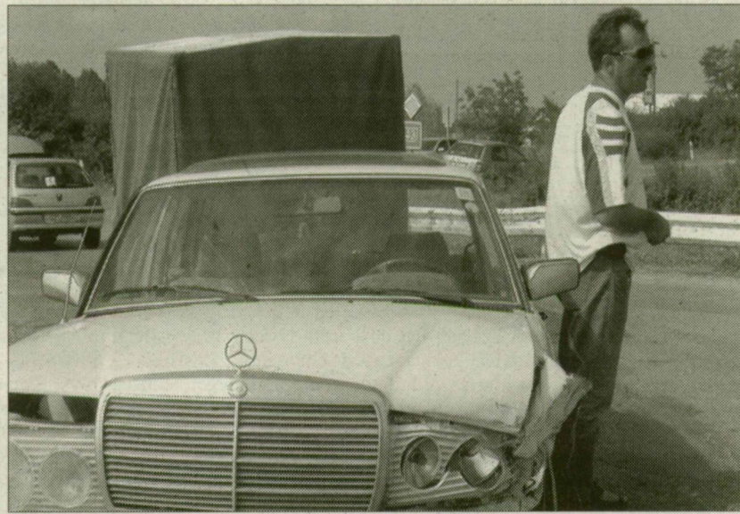
A Mercedes sofőrje szerint itt is elkelne egy körforgalom