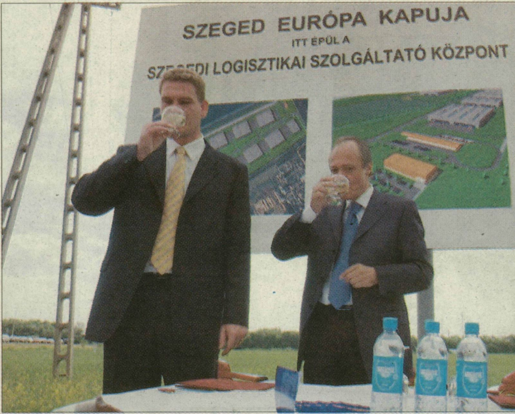
2003. május 19.: Botka László szegedi polgármester és Medgyessy Péter miniszterelnök pezsgővel ünnepelt, amikor a területet megkapta a város

Megnéztük az egykori repceföldet: nemhogy üzemépület nem nőtt a finomöntődének, de utak és közművek is hiányoznak. Mintha semmi nem mozdult volna. A GlobálLog Kft. ügyvezető igazgatójától, Vörös Bélától megtudtuk, a napokban szerződést módosítottak a finomöntődével, eszerint a végleges átadási határidő egy évet csúszik, vagyis jövő október lesz. Mi a csúszás oka? Nagyon elhúzódtak az engedélyezési eljárások, a GlobalLognak még meg kell ol-