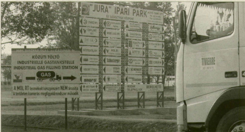
Az egyik legnépesebb Csongrád megyei ipari park az algyői Jura