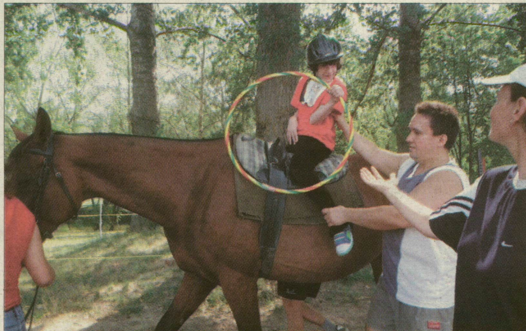
Karikával a nyeregben – a lovas terápia gyakorlatai a mozgáskoordinációt is segítik

Lovas terapeutának gyógypedagógus vagy gyógytornász diplomával lehet jelentkezni. A képzésen évente mindössze ketten-hárman végeznek. A német vizsgabizottság előtt többek között díjugratásból és díjlovaglásból is számot kell adni.