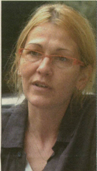
Szabó Gabi színművész és televíziós műsorvezető-szerkesztő