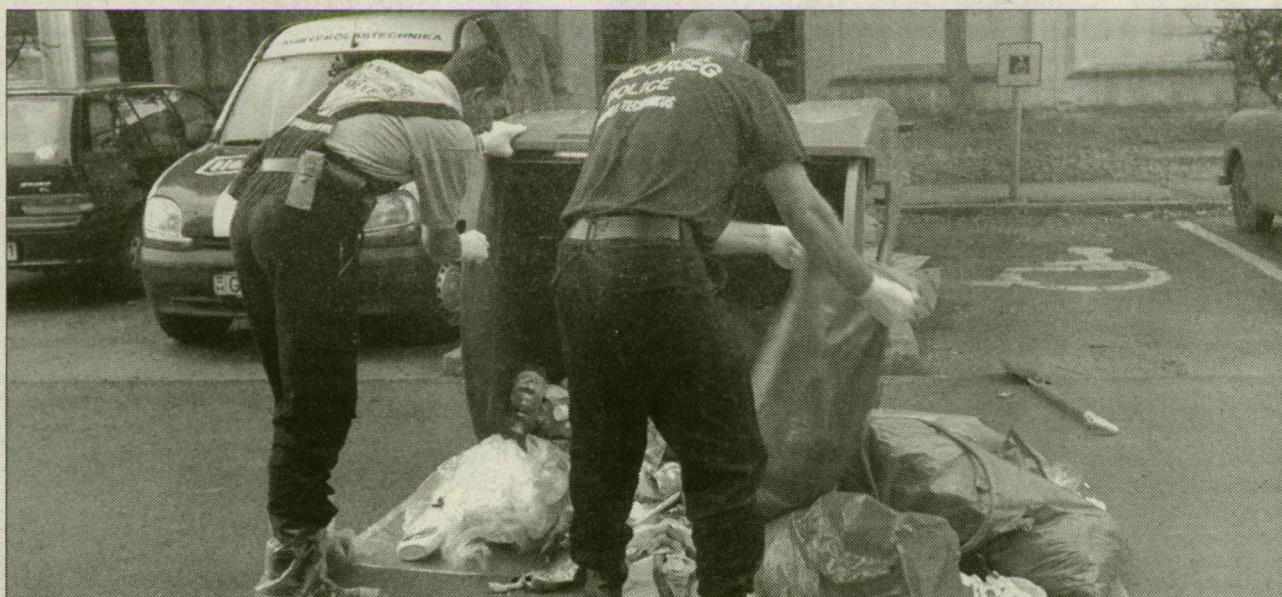
A szemeteskonténereket is átvizsgálták a rendőrök

Információk szerint a meggyilkolt lányval együtt élt férfi négy éve dolgozik a Csillagban, a Szegedi Fegyház és Börtön körletfelügyelője. Tegnap reggel nem jelentkezett munkára, ezért keresték, de nem találták.