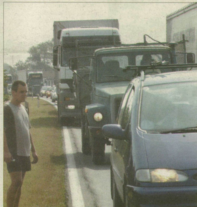
A tegnapi – viszonylag szerencsésnek mondható – baleset helyszínére idején le kellett zárni az utat. Rövid idő alatt óriási járműsor torlódott fel