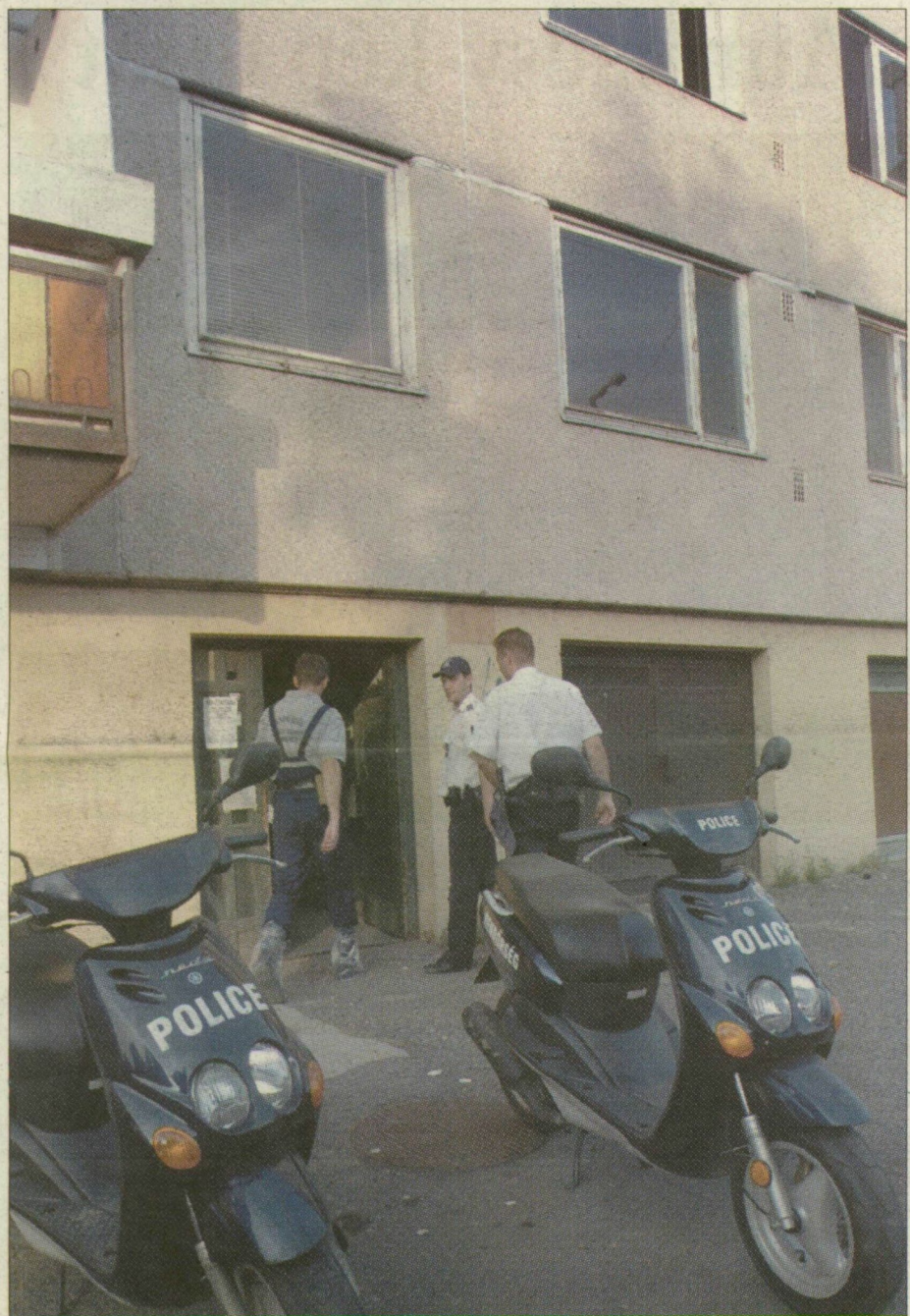
Helyszínelő rendőrök Szegeden, a Vág utcai ház előtt