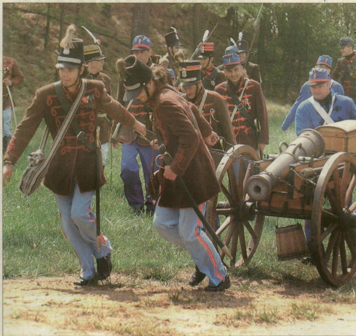
Nyalka huszárok, komoly tüzerek – 5 ország 250 hagyományörzője idézte a múltat