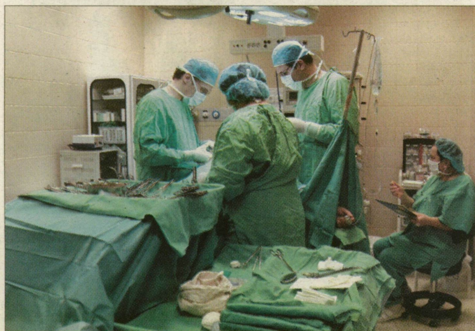
A gyógyító munkát nem hátráltathatja az elbocsátás