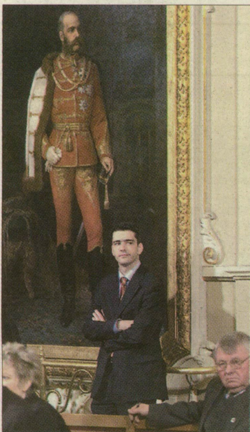
Ferenc József emléként festmény őrzi a szegedi városházi díszteremben

Egy-egy filmmel tiszteleg a filmtörténet hétfőn elhunyt legendás alakjai előtt a Magyar televízió. Ingmar Bergman svéd rendező Suttogások és sikolyok című filmdrámája tegnap volt látható; az olasz mester, Michelangelo Antonioni Nagyítás című filmjét pedig ma 23.15-től sugározza az m1. A Duna Televízió vasárnaptól kezdve Ingmar Bergman 11 filmjét tűzi műsorára. Holnap este 21.20-kor a világhírű svéd rendező utolsó alkotását, a 2003-ban készült Sarabandot láthatjuk.