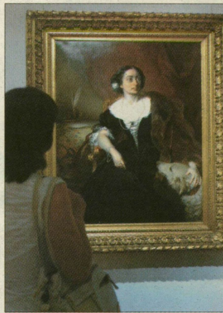
Friedrich von Amerling megfestette a tehetséges tanítványt

A fiatal pár Pesten, mai Gresham-palota helyén rendezte be a Nákó-rezidenciát,