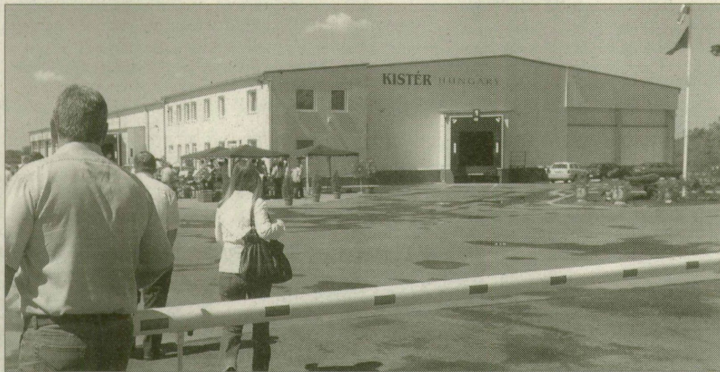
Zöldségekre vár az új hűtőház