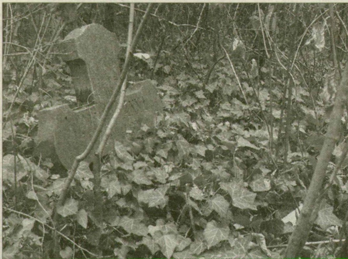
Félig elsüllyedt kereszt a rabtemetőben