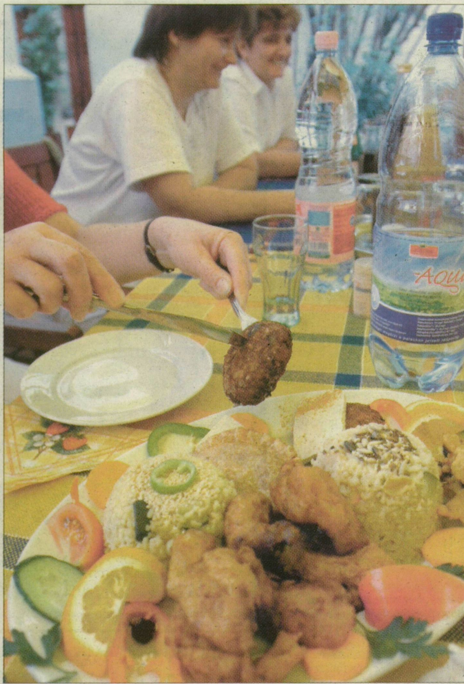
Vegetáriánus étterem Szegeden. A rakott zöltség népszerű

Hol lehet Szegeden minőségi vegetáriánus ételt enni? Egyetlen vegetáriánus éttermet találtunk Szegeden: a két éve üzemelő Agnit. A hagyományos magyar ízek kedvelői és az indiai konyha szerelmesei egyaránt megtalálhatják ott a szájízüknek megfelelő finomságokat. – Nem ragaszkodunk a pörkölt zamatához, ételünk 70 százalékát a töltött, rakott, olajban sült zöltségek teszik ki. A többi fogás indiai receptek alapján készül. Népszerűek a csöben sült rakott zöltséges ételek, illetve a fasírtfeleségek zöltségekkel, olajos