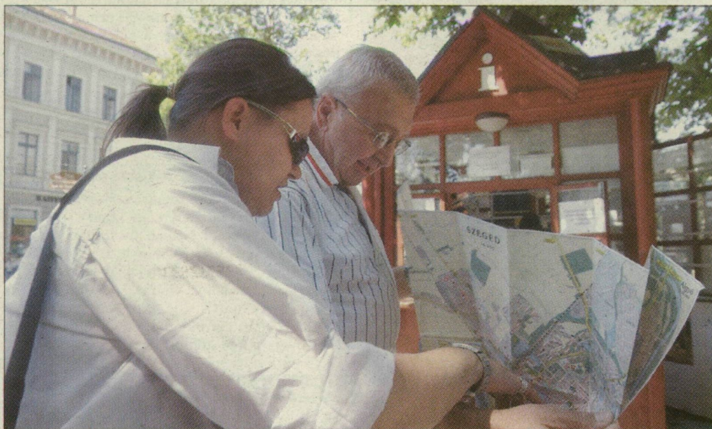
Jó néhány utcát hiába keres a turista Szeged térképén