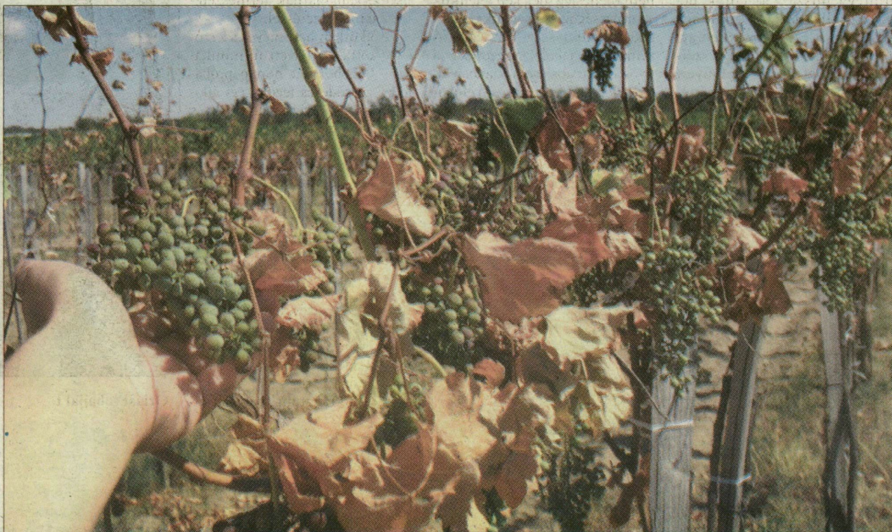
Satnya szőlőszemek a csongrádi határban