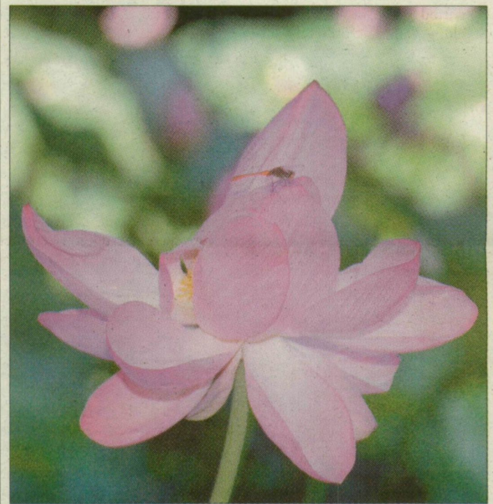
A trópusi növény a szegedi fűvészkertben is virít