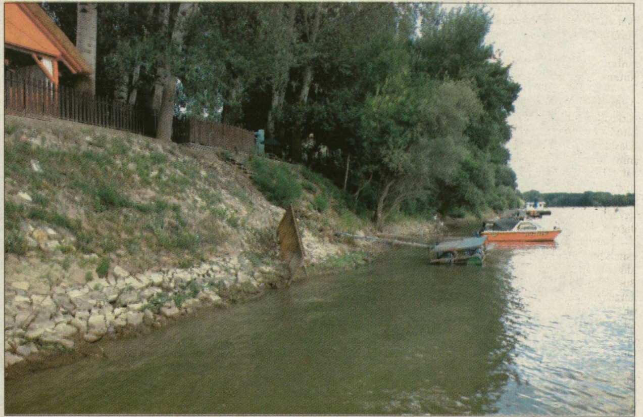
A Kiskőrösi halászcárdánál a duzzasztás előtt át lehetett gyalogolni a túlpartra a Tiszán