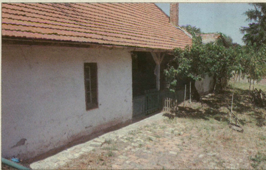
Az önkormányzat 40 millió forintot fordít a Nyíl utcai napsugaras házra