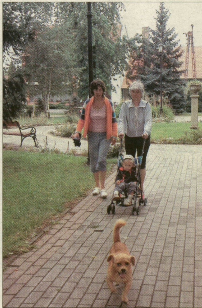
Üllés központja rendezett és zöld

Évekkel ezelőtt nyugati országokban járva irigykedtünk, mennyire rendezettek és virágosak a falvak. Nem kellett sokáig várni,