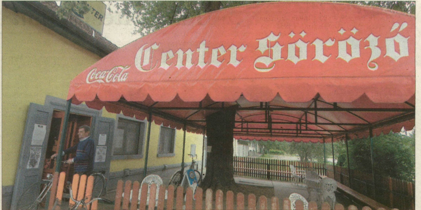
A szegvári Center sörözőben a baleset éjszakáján látták a fiatalokat