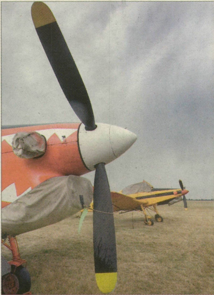
A szegedi repteret egyelőre inkább alkalmanként és kis gépek vezetik igénybe