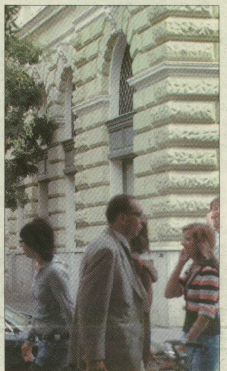
A belvárosban is újabb lakások kerültek el a tilalmi listáról