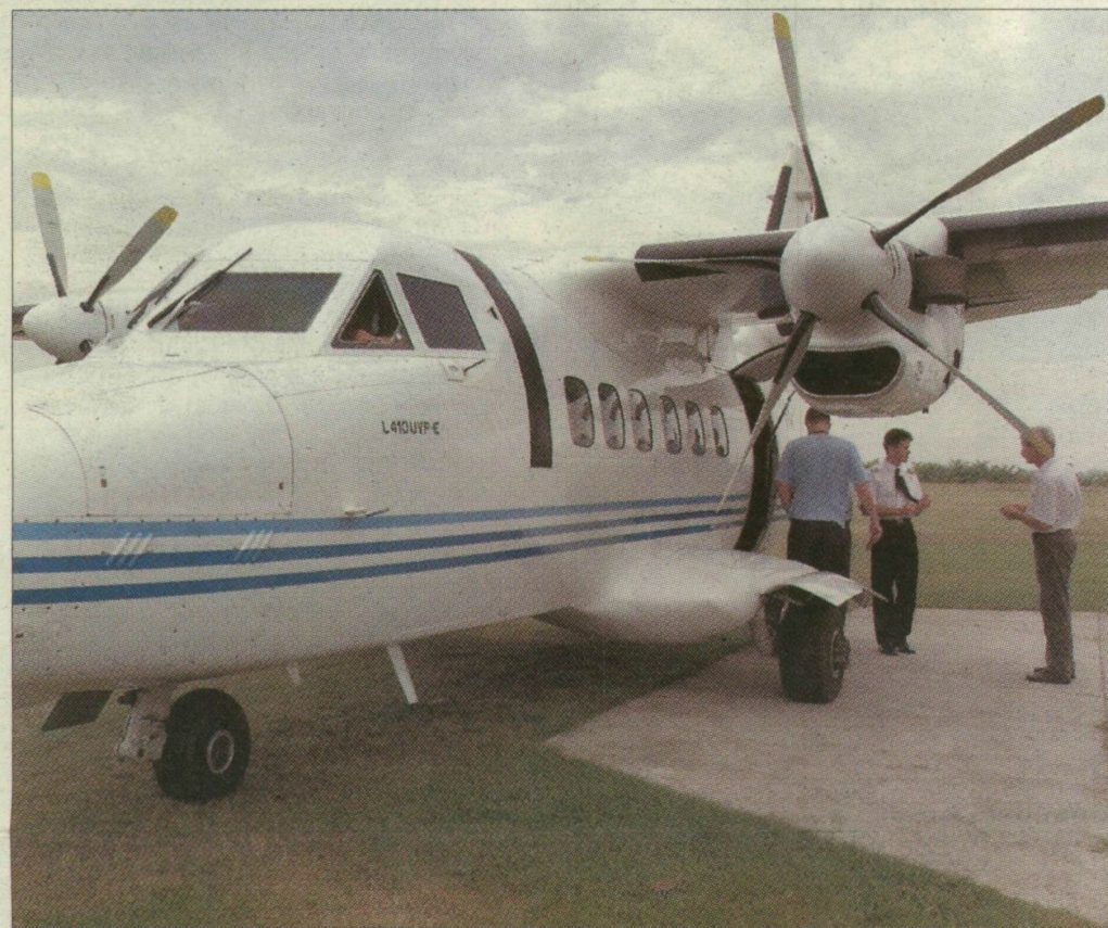
Turistákkal indul Dubrovnikba a repülőgép a szegedi reptérről. 2004 nyarán szállt fel az utolsó járat

A szegedi önkormányzat tárgyal egy befektetővel, amely nem csupán működtetné, de tovább is fejlesztené a tavaly másfél milliárd forintból korszerűsített repteret, ahonnan idén nyáron sem indulnak charterjáratok.