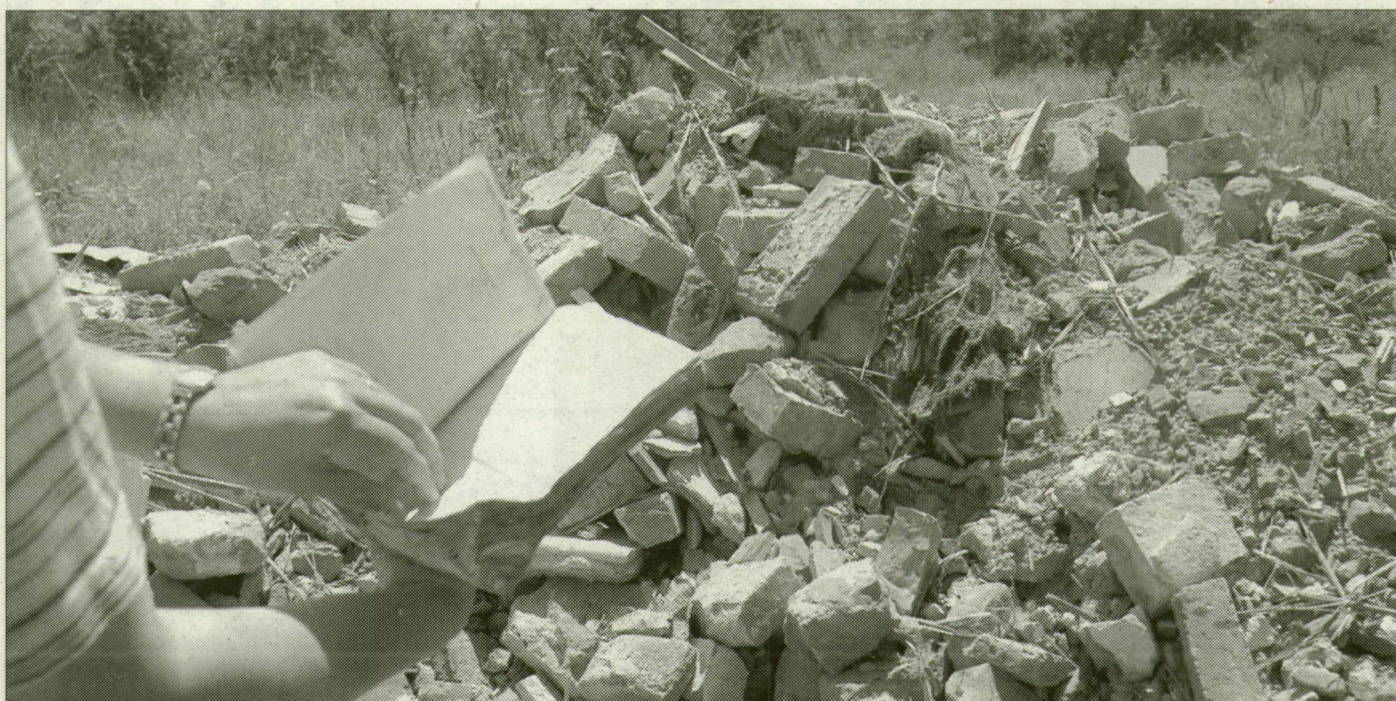
Több ezer köbméter betont, téglát hordtak a szőregi állomás mögé. Olvasnivaló is akad