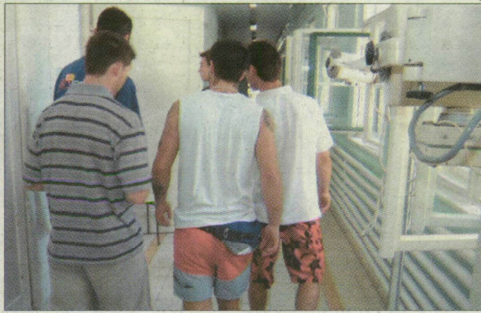
A sérülteket a szentesi kórházban tegnap már a barátok is meglátogatták.