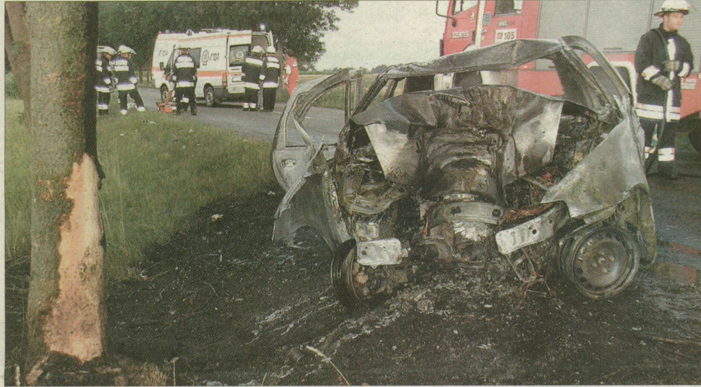
A kitért, felismerhetetlenségig összeroncsolódott autó maradványai az árokparton