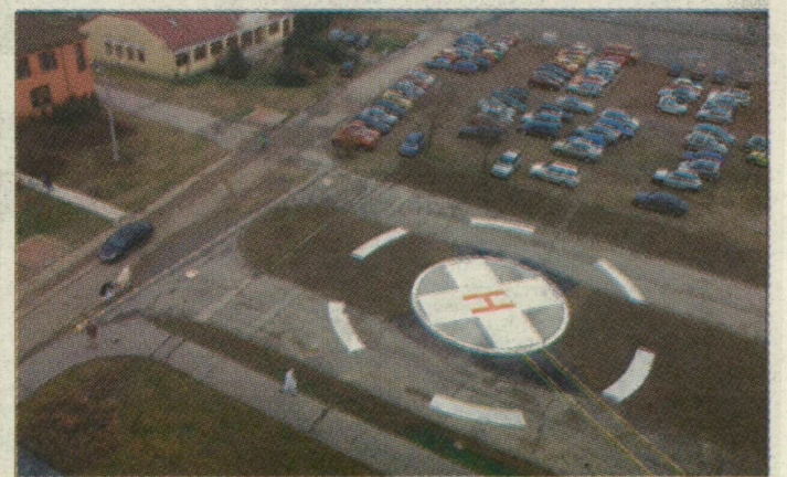
Helikopterleszálló-hely az új klinika mellett