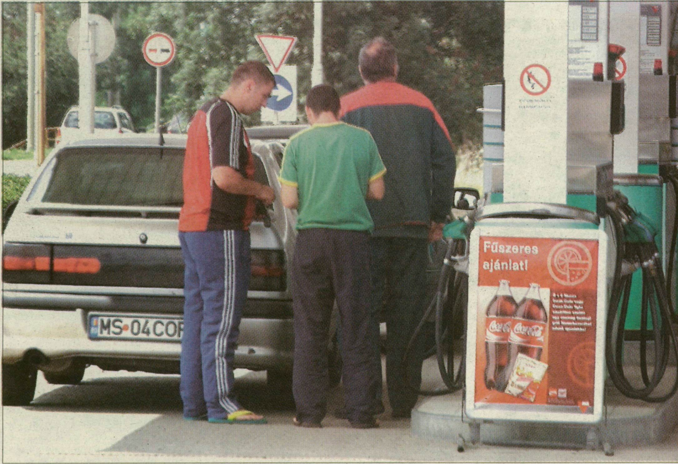
A főút menti kutaknál mindig áll román autó