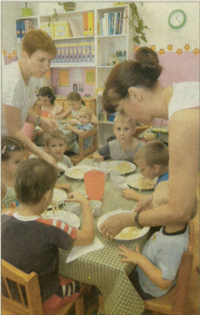
Frankfurti leves és grízes tészta az ebéd a Micimackó óvodában. A gyerekeknek ízlett