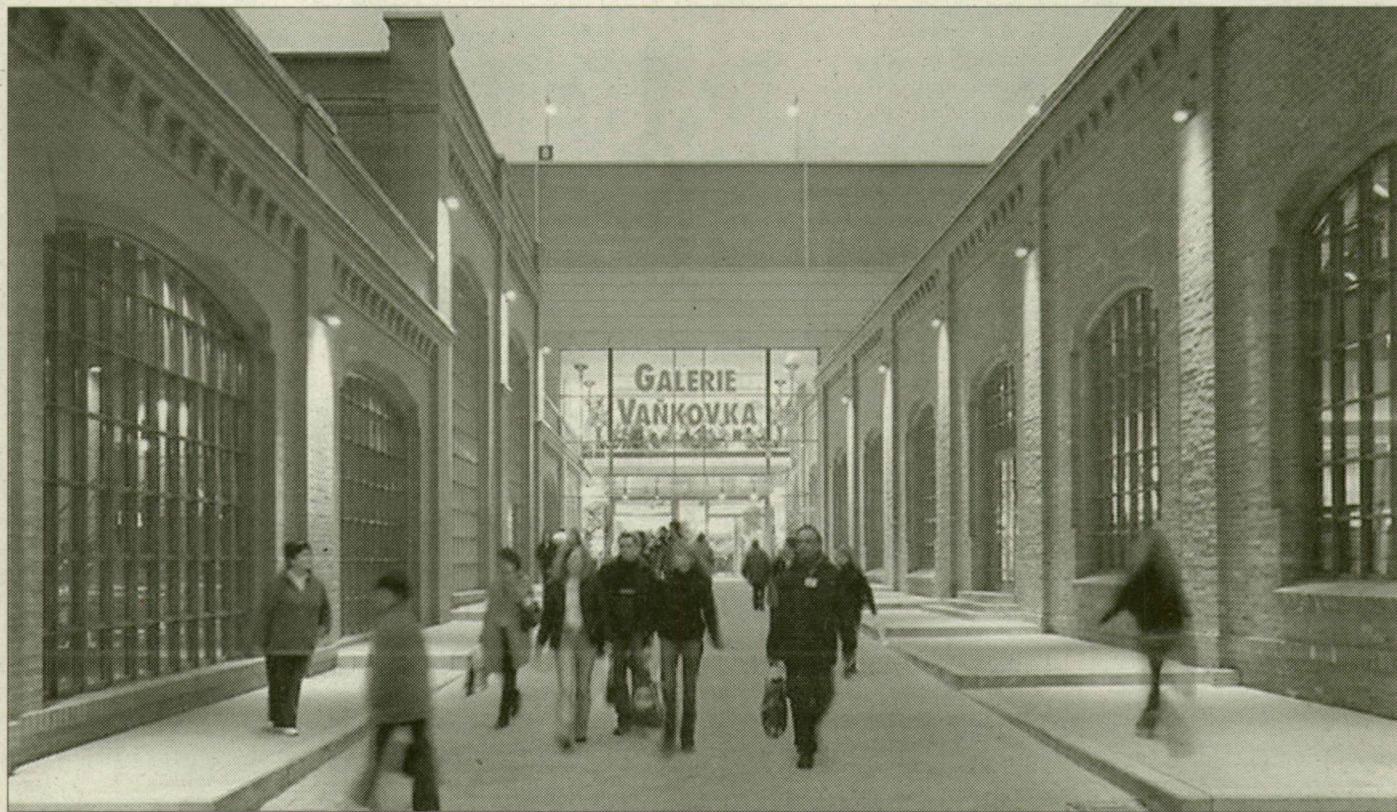
A csehországi Brnóban egy hajdani gyár épületét integrálták az Árkádba

Árkád bevásárlóközpont épül jövőre Londoni körúton. A center 2009 végén vagy 2010 elején nyitja meg kapuit, mintegy 800 új munkahelyet teremtve. A szeptember 11-én tartott közgyűlés holnap szavaz a tömb szabályozási tervéről.