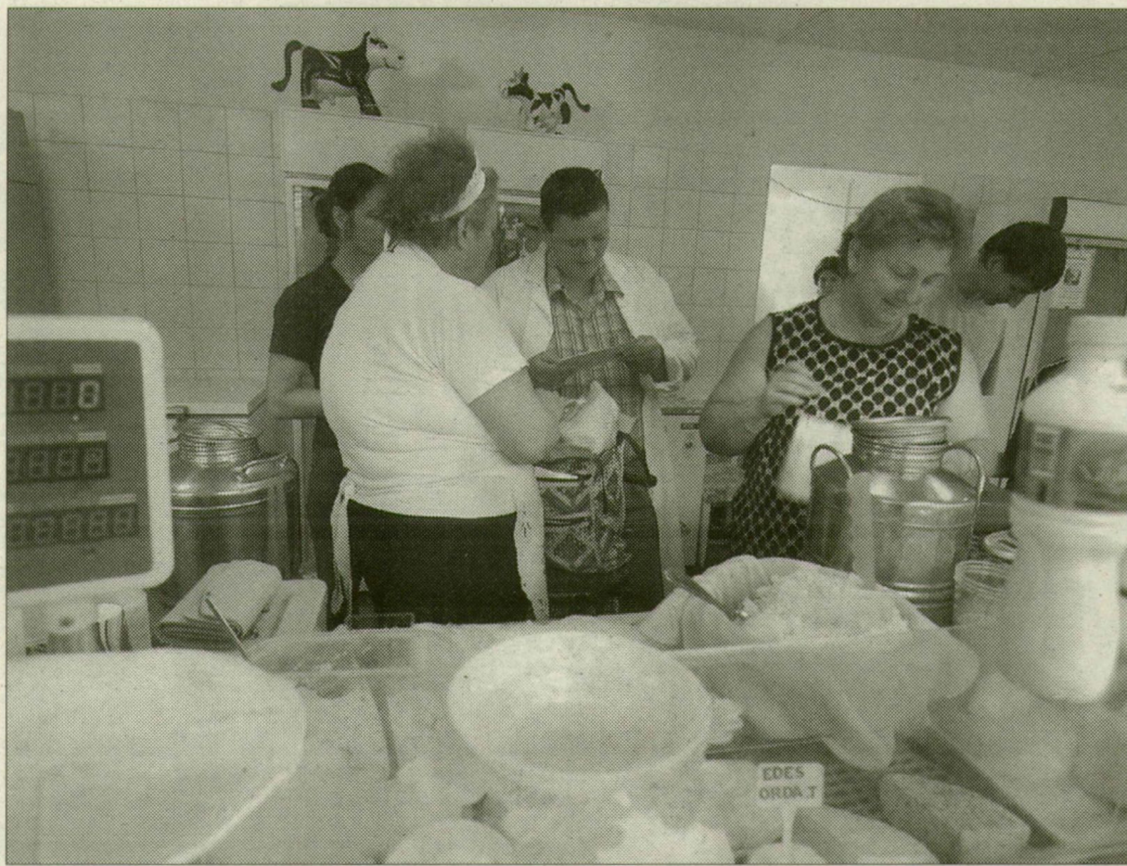
Köpenytől a hűtőn át a flakonig mindent átnéztek az ellenőrök

Az ellenőrök a tejtermelés „eljével” kezdtek, minden árustól elkérték az állataik orvosi igazolását. Megnézték az árusítás körülményeit: a mosogatók, pultok tisztaságát, a takarításról vezetett jegyzőkönyvet. Kinyitották a hűtőket, ellenőrizték a kannák hőmérsékletét, a hűtési naplót. Egy mórahalmi asszonyt figyelmeztettek, hogy ne fagyasztoiban, hanem hűtőben tartsa a tejet. Nála ugyanis a tej plusz három, a fagyasztoháza viszont mínusz három fokos volt. Az asszony ki-be kapcsolgatja a ládát, hogy a tej megfelelő hideg maradjon, és ez hiba. Néhány árusra rászóltak, mert nem viseltek köpenyt, hajvédőt. Erre egy dóci asszony megadóan magára húzta az otthonkáját. Azt mondta, havonta fel-