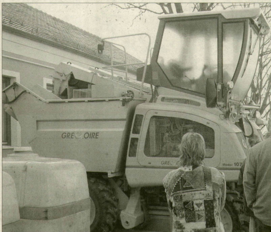
Szőlőkombájnt – itt még csak ismerkedtek vele a csongrádiak