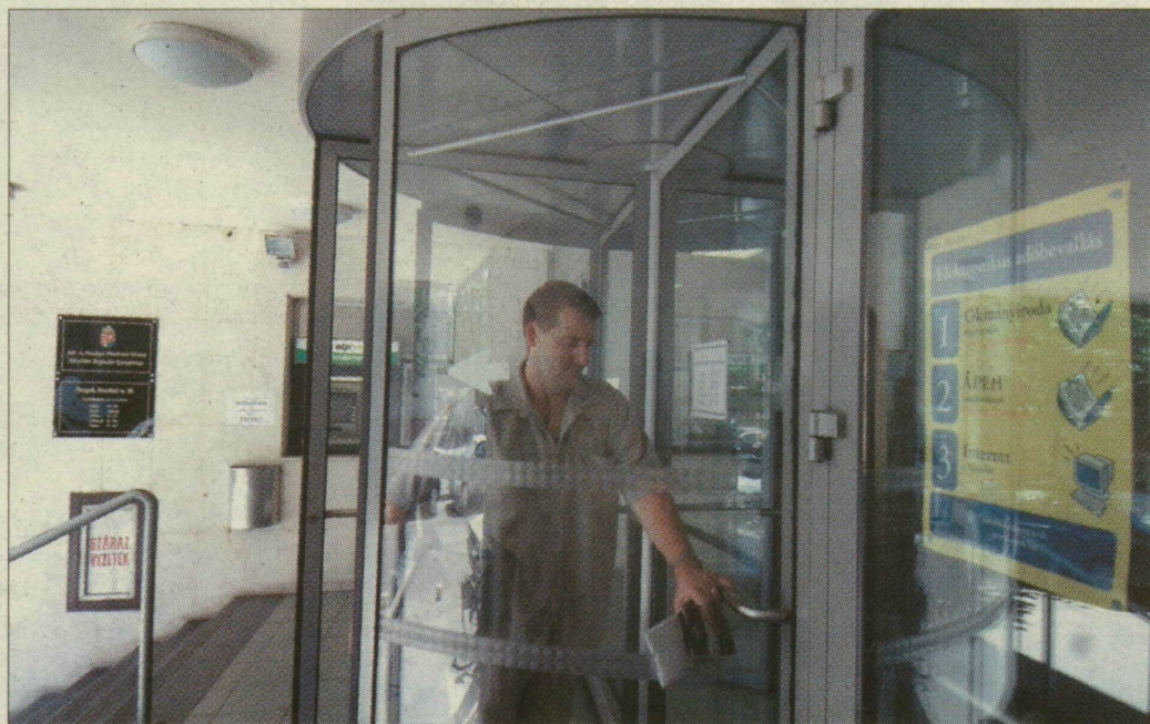
Az APEH-székház bejárata Szegeden

Újabb jelentős szervezeti átalakítás 1982-ben történt, amikor megalakult a PM Ellenőrzési Főigazgatósága. Ennek Csongrád megyei igazgatósága – 83 szakemberrel – a Londoni körúton kapott helyet. Ez a szervezet ellenőrizte a térszerek, az ipari szövetkezetek és a nagyvállalatok pénzügyi gazdálkodását, 1984 után pedig a gmk-kat is. A szocializmusban a kisiparosok, kereskedők és magánszemélyek adóztatása és kontrollja az adómegállapító hivatalok és a tanácsok hatáskörébe tartozott.