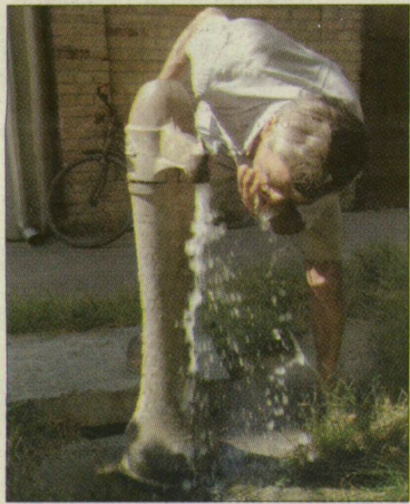
Akadnak, akik csak a szomjukat oltják a köztéri kutak vizéből