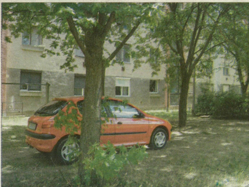
Autó a tilosban. Sokan vágnak keresztül a zöldön