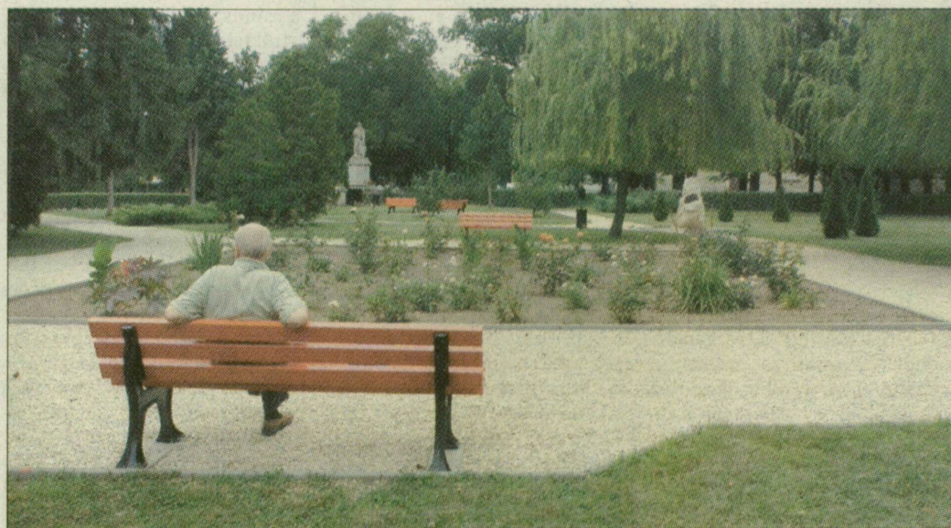
A falu templomtere igazi főtér: szeretik, gondozzák a helybeliek

A XX. századi urbanizáció persze Földeákat is megérintette: a lakosság szám apadni kezdett.