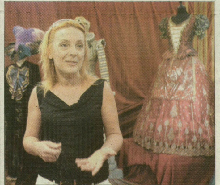
Zoób Kati: Aki hamis, az biztos nem érzi jól magát a környezetemben