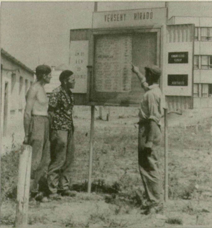
A kor szelleme. Szocialista munkaverseny