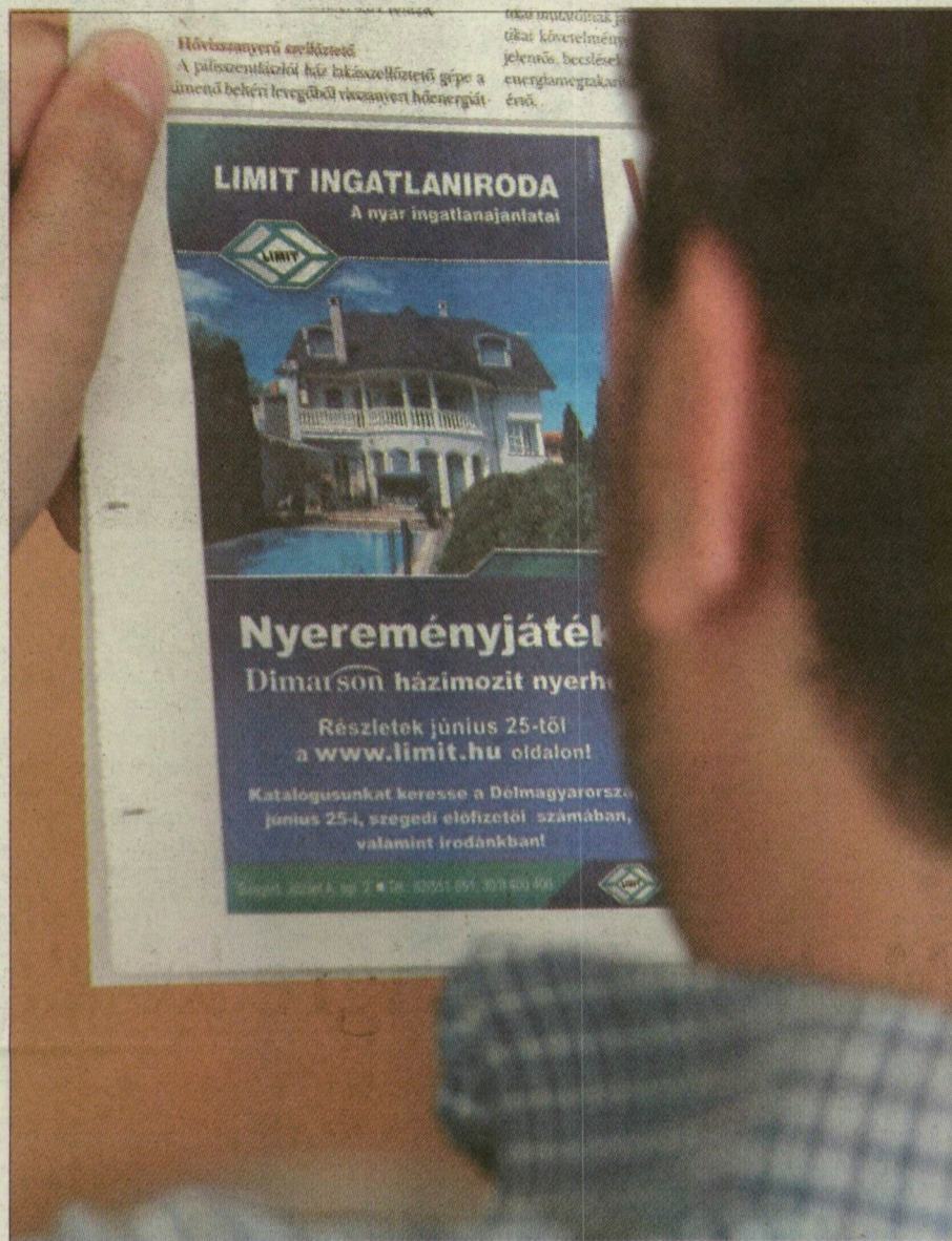
A hirdetésekben valódi csodapaloták is feltűnnek