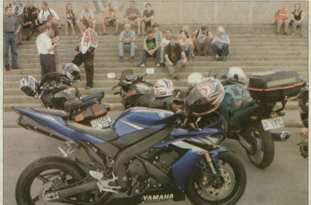
A szegedi motorosok minden este összejönnek a rakparton