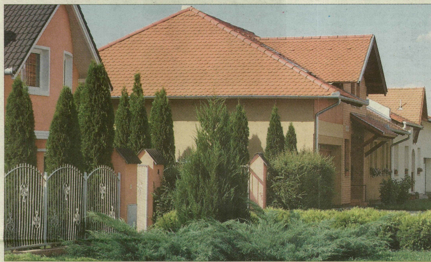
Szeged Rózsadombja Újszeged. Itt található a legdrágább házak a városban