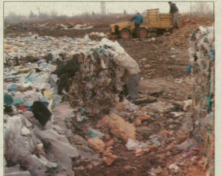
A tavaly decemberben idehozott import hulladék a mai napig itt van.