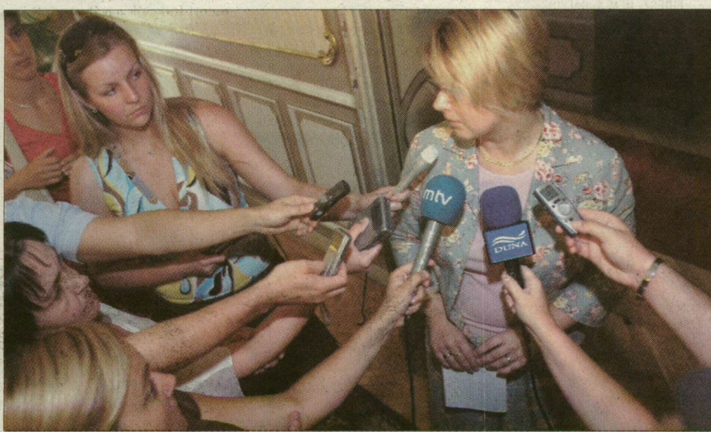
Horváth Ágnes egészségügyi miniszter a média figyelmének középpontjában

A találkozó utáni sajtótájékoztatót Botka László polgármester elmondta, szóba került a város egészségügyi fejlesztése, a Biopolisz-projekt részeként tervezett új klinikai tömb megépítése is: erre a 2007 és 2013 között egészségügyi infrastruktúra fejlesztésére fordítható 270 milliárdos uniós forrásnak a tíz százalékát szeretnék elnyerni. A polgármester július 5-ére összehívja a közgyűlést, amely dönt az egyetem integrációs